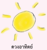
ดวงอาทิตย์

สมัยตายเป็นเด็กตัวเล็ก ๆ ในโรงเรียนประถมกระต่าย แห่งหนึ่ง ตายเรียนรู้ผ่านการบอกเล่าให้จดให้จำเรื่องเกี่ยวกับ การสังเคราะห์ด้วยแสงว่า เกิดขึ้นในพืช เป็นกระบวนการสร้าง อาหารของพืชโดยการเปลี่ยนพลังงานแสงมาเป็นพลังงานเคมี ที่อยู่ในรูปของแป้งและน้ำตาล