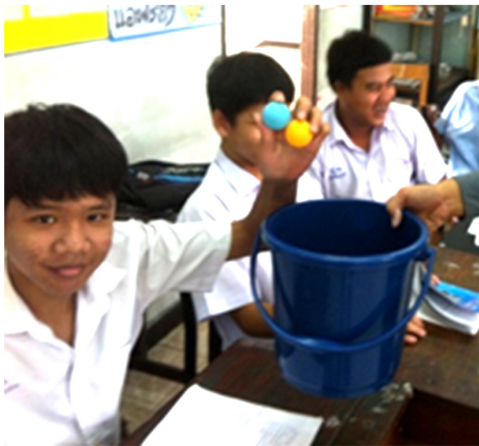
รูปที่ 3 นักเรียนมีส่วนร่วมในการทลายและหีบลูกปิงปองในกิจกรรม “คนละสี่เดียวกัน”

สำหรับการสุ่มหีบลูกปิงปองสีฟ้า 3 ลูก สีส้ม 2 ลูก จากถังสีที่บดแสดงในกิจกรรมนี้ ผลลัพธ์ทั้งหมดที่อาจเกิดขึ้นมีทั้งสิ้น 10 แบบ คือ