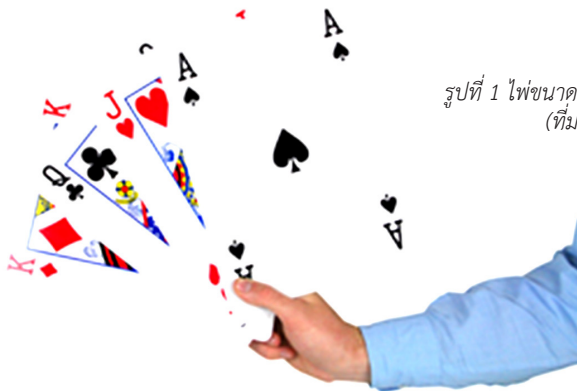
รูปที่ 1 ไพ่ขนาดใหญ่สำหรับกิจกรรม 'ไฟเลี้ยงรัก'

จากนั้นครูอาจท้าทายนักเรียนด้วยการสร้างสถานการณ์ให้ มีตัวละครสมมติ เช่น นายคณิตกำลังตกหลุมรักสาวสวยผู้หนึ่ง อยู่และต้องการรู้ว่าสาวสวยผู้นั้นมีใจให้หรือไม่ จึงเสี่ยงทายว่าถ้า เขาสุ่มหยิบไพ่ขึ้นจากสำรับจำนวน 1 ใบ แล้วได้ไพ่หน้าโพแดง ♥ หรือ แด้มจำนวนคู่ เขาจะสมหวังในความรัก แต่ถ้าไม่ใช่ เขา จะผิดหวังในความรัก แล้วให้นักเรียนทุกคนพิจารณาหาคำตอบว่า โอกาสที่นายคณิตจะเสี่ยงทายแล้วได้ไพ่หน้าโพแดง ♥ หรือ แด้มจำนวนคู่ กับได้ไพ่หน้าและแด้มอื่น ๆ แบบใดจะมากกว่ากัน ก่อนที่จะเริ่มการทดลองจริงด้วยการให้นักเรียนทั้งชั้นสุ่มหยิบไพ่ จากสำรับคนละหนึ่งใบโดยใส่คืนและสับไพ่ใหม่ทุกครั้งพร้อมทั้ง บันทึกผลเพื่อสำรวจผลลัพธ์ที่เกิดขึ้น