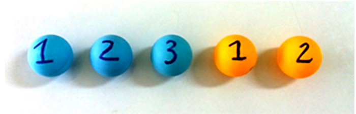
รูปที่ 2 ลูกปิงปองสีฟ้าและสีส้มที่มีหมายเลขกำกับ

ก่อนเริ่มกิจกรรมนั้น ครูอาจชี้แจงให้นักเรียนทราบก่อนว่า ลูกปิงปองที่มีขนาดเท่ากันและมีสีเดียวกันเป็นลูกปิงปองที่ต่างลูกกัน และจำเป็นต้องแยกแยะเสียก่อนว่าลูกปิงปองลูกใดเป็นลูกใด โดยอาจใช้ปากกาเขียนหมายเลขกำกับลูกปิงปองแต่ละลูก เช่น ลูกปิงปองสีฟ้าลูกที่ 1, 2, 3 และ ลูกปิงปองสีส้มลูกที่ 1, 2 ดังแสดงในรูปที่ 2 เพื่อให้ทราบว่าลูกปิงปองที่หยิบได้เป็นลูกใด