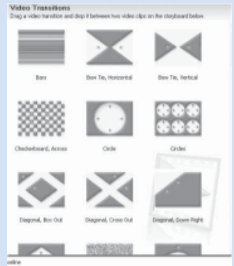
เอฟเฟ็กต์ของรูปเปลี่ยนระหว่างภาพ View video transitions

สำหรับเอฟเฟ็กต์รูปแบบต่างๆ ก็จะมีให้เลือกที่ หัวข้อที่ 2 Edit Movie คุณสามารถเลือกเอฟเฟ็กต์ของรูปภาพ หรือวีดิทัศน์ได้จากตัวเลือก View video effects โดยคลิกลากไปวางบนรูปภาพที่ต้องการได้เลย ส่วนเอฟเฟ็กต์ของการเปลี่ยนระหว่างภาพก็เลือกได้จากตัวเลือก View video transitions นอกจากนี้ Movie Maker ยังให้คุณสามารถใส่ข้อความลงไปประกอบการบรรยายได้อีกด้วย ที่ตัวเลือก Make titles or credits เมื่อทุกอย่างเรียบร้อย ก็ลองทดสอบดู โดยกดที่ปุ่ม เล่น (play) หรือเพื่อความสะดวกจะใช้แค่ Space bar บนคีย์บอร์ดก็ได้