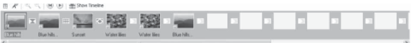
Time Line เส้นแสดงเวลา จะแสดงอยู่ด้านล่างสุดสำหรับปรับแต่งภาพ เสียง และภาพยนตร์ ว่าจะให้แต่ละส่วนมีช่วงเวลาทำงานเป็นอย่างไรบ้าง